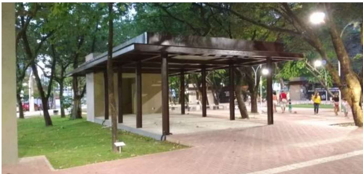
Imagem 2: Vista do Quiosque Padrão.

Imagem 1: Planta de implantação com a localização do quiosque 2.